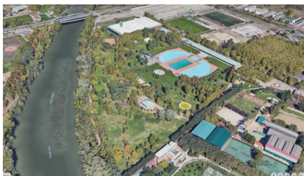
Complejo Deportivo Municipal Las Norias

El certamen musical se realizará en la Plaza de Toros de Logroño, a escasos 900m del Centro.